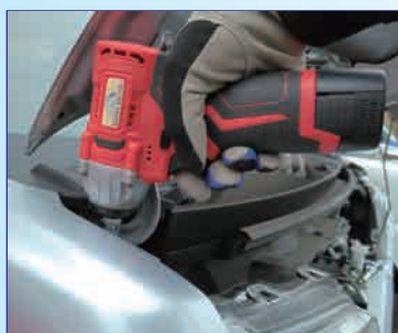
※先端工具は付属しておりません。